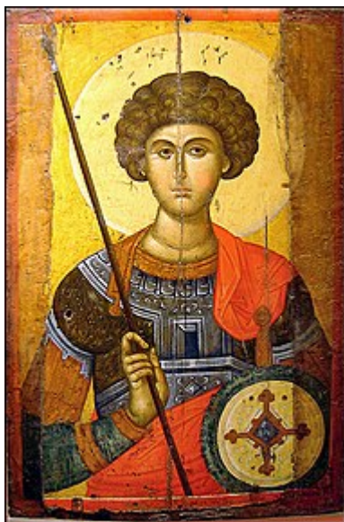
Ícone de São Jorge, Museu Cristão-Bizantino, Atenas

afirmou que os os ídolos adorados nos templos pagãos eram falsos deuses.